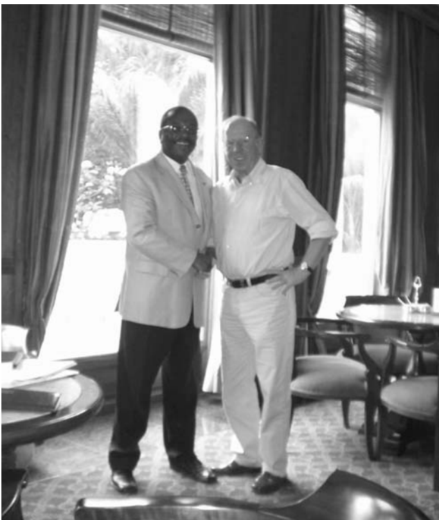
Präsident Siegfried Lingel mit dem Minister für Jugend und Sport Joel Matias Libombo

In den letzten Jahren konnte die mosambikanische Regierung mit ihrer Politik der wirtschaftlichen Liberalisierung und Öffnung bemerkenswerte Erfolge erzielen. Die Überschwemmungskatastrophen im Frühjahr 2000