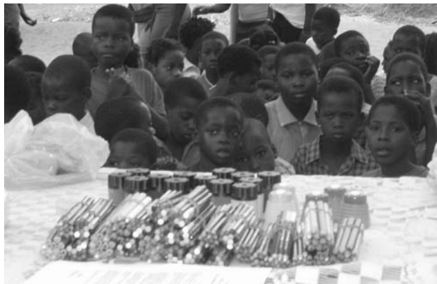
Geschenkübergabe an Schüler