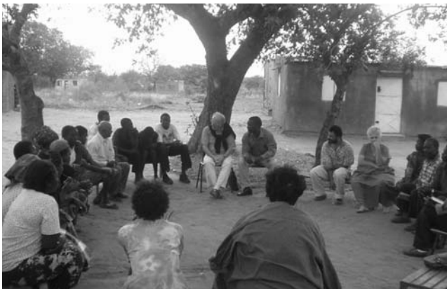
Schulprojekt in Matola-Rio

Viele Frauen und Mädchen sind auf sich alleine gestellt, da ihre Männer und Familienväter die Familien im Stich gelassen haben. Von diesem Projekt profitiert eine Gruppe von 50 Frauen und Mädchen im Alter von 15 bis 60 Jahren. In den meisten Fällen sind die Frauen An-