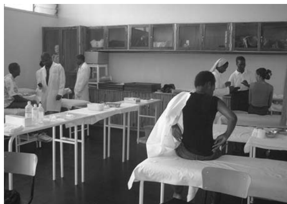
Medizinische Fakultät der Kath. Universität

An der Medizinischen Fakultät lehren derzeit 20 Professoren. In diesem Jahr sind fünf Hochschullehrer neu hinzugekommen. Dabei handelt es sich um zwei Ärzte