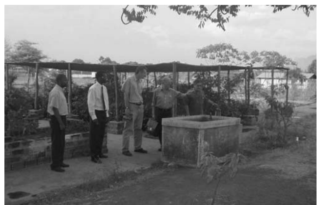
Baumschule und Brunnen der landwirtschaftlichen Fakultät

Voraussetzung für ein Studium ist das Abitur, das nach zwölf Jahren Schule abgelegt werden kann. Das Studium dauert vier Jahre. Darin eingeschlossen ist ein Jahr Vorbereitungskurs, bei dem im Durchschnitt 20 Prozent der Teilnehmer durchfallen. Das Studium schließt mit dem Diplom „Bachelor Landwirtschaft“ ab. Bisher haben 26 Studenten ihr Studium mit dem Bachelor abgeschlossen. Alle haben sehr schnell Arbeit gefunden. Elf Absolventen arbeiten bei staatlichen Unternehmen bzw. bei privaten Organisationen, die mit dem Staat zusammenarbeiten. 15 Absolventen satteln nach dem Studium noch ein Jahr darauf und schließen dann mit dem „Bachelor of Honorar“ ab.