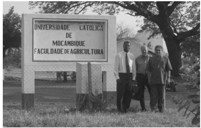
Landwirtschaftliche Fakultät der Kath. Universität

Besonders hervorzuheben ist, dass die Medizinische Fakultät im Oktober dieses Jahres mit der Einrichtung einer kleinen Klinik an der Universität begonnen hat. Hier können Studenten nach den ersten drei Jahren ihres Studiums in der Praxis den Umgang mit Krankheitsbildern wie Diabetes, Asthma und Bluthochdruck erlernen. Die Klinik leitet ein englischer Arzt. Das Studium erstreckt sich insgesamt über sieben Jahre, das heißt 2007 verlassen die ersten fertigen Mediziner die Medizinische Fakultät der Katholischen Universität.