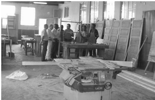
Handwerksschule in Moamba

An der Handwerksschule werden insgesamt rund 300 Schülerinnen und Schüler unterrichtet. In dem der Schule angeschlossenen Waisenhaus sind zur Zeit 80 Kinder untergebracht. Alle sind Vollwaisen. Die meisten