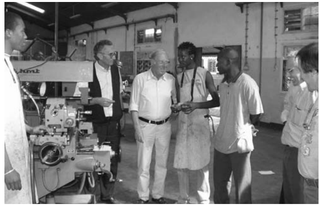
Handwerksschule in Lhanguene

Während des Jahres 2003 hat die Mission von Lhanguene ihre Aktivitäten mit Hilfe der Deutsch-