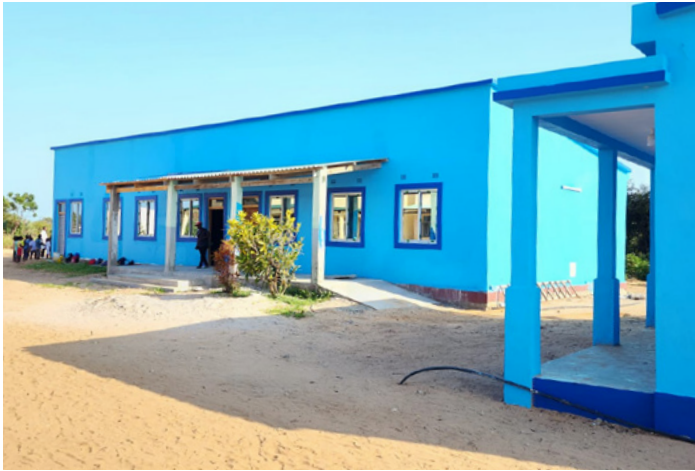
■ In Mangalisse ist durch Umbau und Erweiterung eine vollwertige Basisschule entstanden.