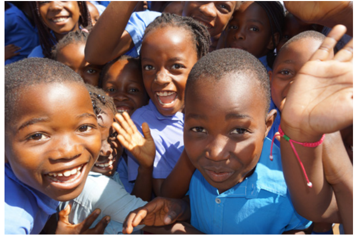
■ Grundschulkindern – wie hier in Mangalisse – kommen meistens erst mit der Einschulung in Kontakt mit ihrer Landessprache.