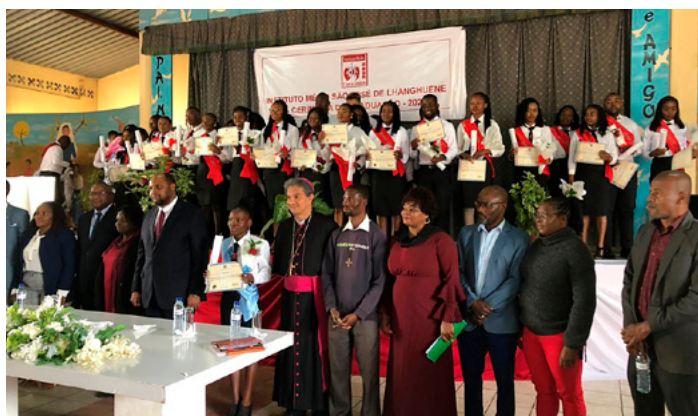
In der Berufsschule in Lhanguene hat der erste Jahrgang den Kurs Buchhaltung und kaufmännische Lösung abgeschlossen.