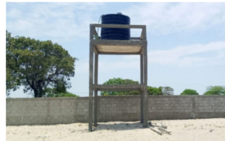
Ein Wassertank versorgt die Berufsschule mit Trinkwasser.

In der Berufsschule der Salesianer in Lhanguene haben die ersten Auszubildenden den Kurs Buchhaltung und kaufmännische Lösung abgeschlossen. Am 23. August haben 53 Absolventen nach ihrer zweijährigen Ausbildung ihr Diplom feierlich ausgehändigt bekommen. Dieser Kurs beinhaltet das Erlernen des Programms Primavera, die gefragteste Business-