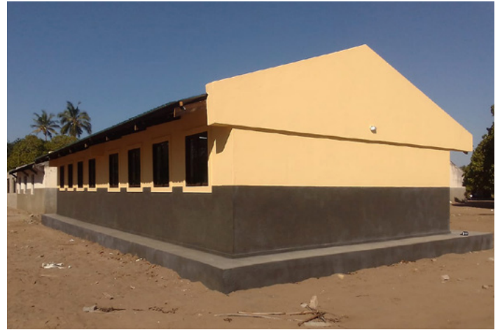
■ An der Sekundarschule Maguiguana wurden im letzten Jahr drei Klassenzimmer saniert und drei weitere Zimmer neu gebaut.