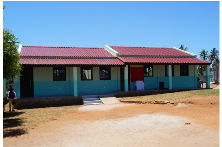
■ Im Jahr 2024 konnten in Massinga zwei neue Klassenräume und eine WC-Anlage fertiggestellt werden.