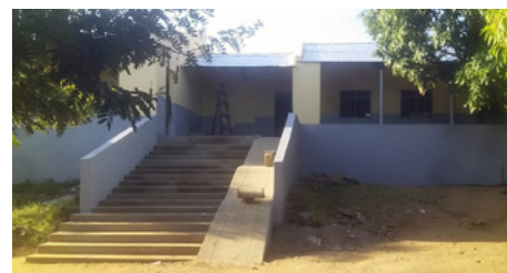
Fast nicht wiederzuerkennen – die Grundschule in Xai-Xai vor und nach der Renovierung.