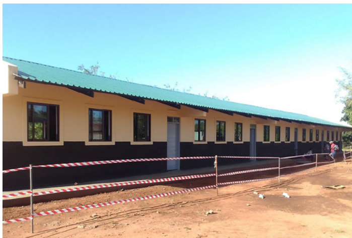
■ An dieser Grundschule in Macalawane hat die DMG im Jahr 2024 die bestehenden Gebäude saniert und weitere Klassenzimmer gebaut.

Die DMG ist hier in intensiven Gesprächen, wie, in welchem Umfang und in welchem Zeitrahmen sie hier unterstützen kann. Im Jahr 2024 konnten bereits – finanziert durch die Otto-Kieninger Stiftung – drei bestehende Klassenzimmer saniert bzw. fertiggestellt sowie drei neue Klassenzimmer gebaut werden, die mit wetterbeständigeren Aluminiumfenstern ausgestattet wurden.