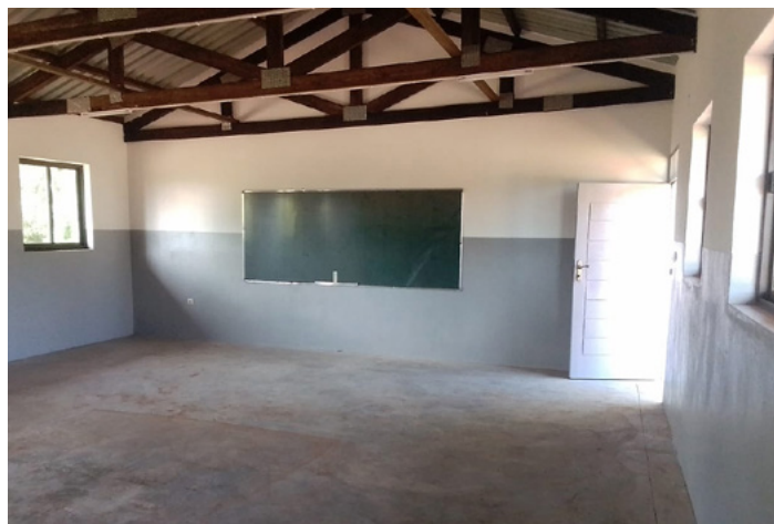
■ In Macalawane hat die Distriktverwaltung jetzt auch für einen Strom- und Wasseranschluss der Schule gesorgt.