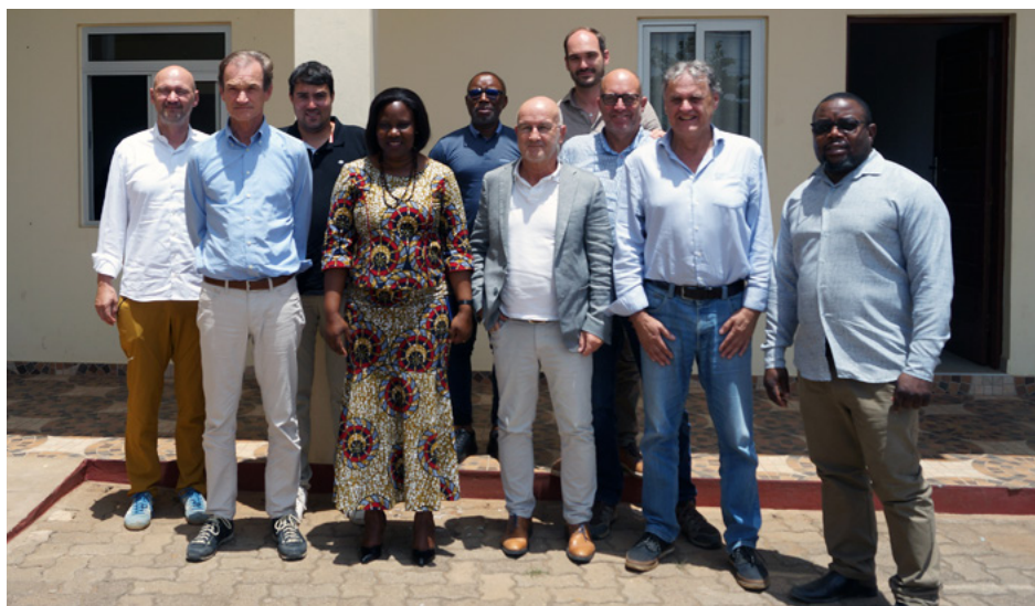
Das Kuratorium der DMG vor Ort beim Besuch eines Förderprojekts.