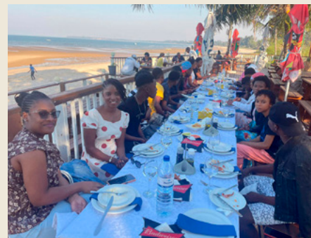
Die DMG-Stipendiaten lernen sich bei einem Ausflug gegenseitig kennen.