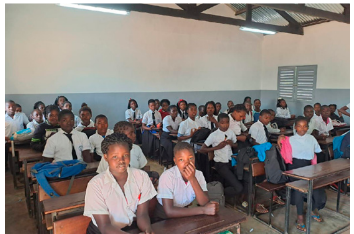
■ Die DMG hat an der Schule in Mavie im Jahr 2024 in großem Umfang saniert und neu gebaut.