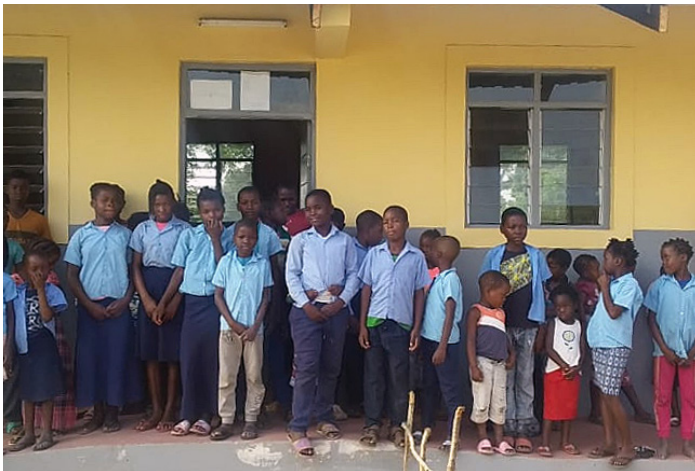
■ Schüler vor dem neuen Gebäude in Incaia.