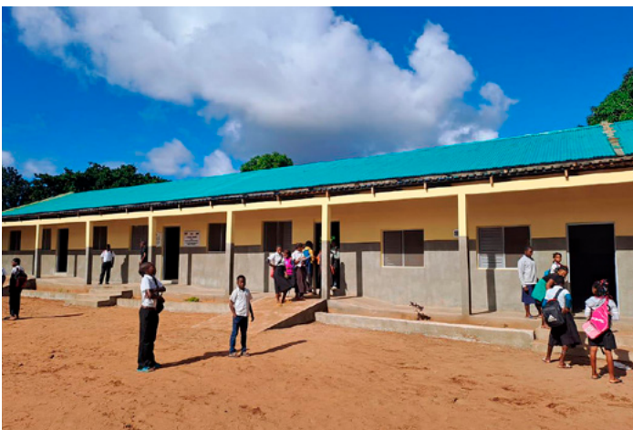
■ An dieser Schule in Mavie werden aktuell 813 Schüler von 16 Lehrern von der 1. bis zur 7. Klasse unterrichtet.

In Mahungo (Distrikt Bilene | Provinz Gaza) gibt es seit dem Jahr 2020 eine von Familie